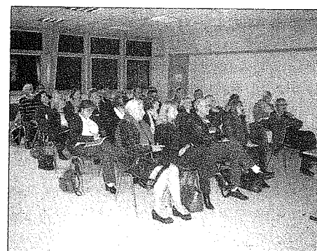
■ Réunion d'information organisée par la mairie. Chaque usager, un cas particulier.

50 partenaires (compagnies et mutuelles). "Ma commune, ma santé" est l'opération lancée par Actiom auprès des municipalités, mais sans lien contractuel avec elles. Celles-ci peuvent informer les habitants, héberger une boîte aux lettres d'Actiom. Cœur de cible: non salariés, personnes isolées et/ou en précarité, retraités. Tarifs et prestations peuvent être différenciés dans un foyer. « Si demain, des adhérents sont déçus, les prestataires pourront changer », précise le maire.